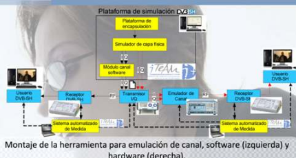
Montaje de la herramienta para emulación de canal, software (izquierda) y hardware (derecha).

Utilizando la herramienta se puede construir una cadena de transmisión extremo a extremo que permita realizar demostradores de la propia tecnología. Estos demostradores pueden ser adaptados para cubrir revisiones del estándar, aportaciones interesantes no contempladas en el mismo y también nuevos estándares.