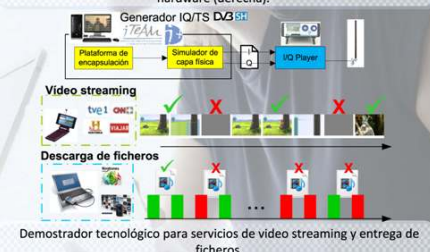
Demostrador tecnológico para servicios de video streaming y entrega de ficheros.